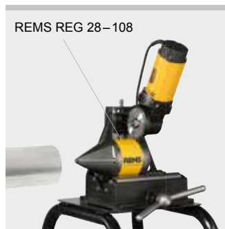
REMS REG 28–108