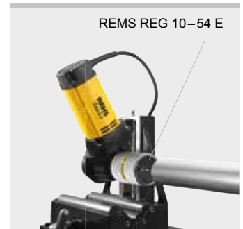
REMS REG 10–54 E